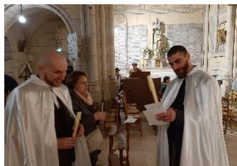
Chapelle du Carmel

prière personnelle et quotidienne ; continuer à se former pour approfondir sa foi ; donner de son temps pour se mettre au service des autres, notamment dans sa paroisse ; et participer à l'évangélisation en osant assumer sa foi et la partager avec qui voudra bien l'écouter. Ces points sont basés sur les premières communautés chrétiennes dont parlent les Actes des Apôtres : "Ils étaient assidus à l'enseignement des Apôtres et à la communion fraternelle, à la fraction du pain et aux prières..." (Act. 2, 42-47).